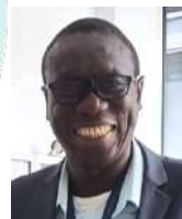
Par Ibrahima Badiane et Saïd Habouchi

Si vous avez des questions complémentaires, contactez vos représentants CFDT à la commission logement